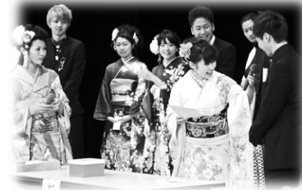
前回、成人式の様子