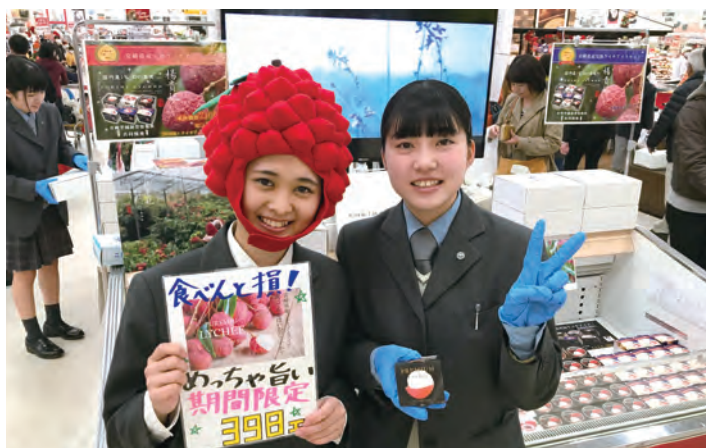
開発を手伝ってくれた宮崎学園高生が販売も担当してくれました。

こ ゆ財団が開発を進めていた、国産ライチを使ったアイスクリームがついに完成。昨年末の12月22日～24日の3日間、イオンモール宮崎で限定販売を行ったところ、なんと1,800個を売り上げました！