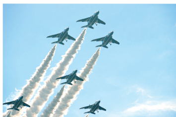
新田原エアフェスタで披露された、ブルーインパールの展示飛行の様子です。