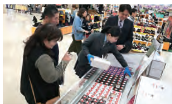
お土産で購入される方が多数！ デザインも高校生の手によるもの。

この「完熟ライチアイス」は、白水舎乳業さんと宮崎学園高校によるコラボで開発したもの。昨年7月には宮崎学園高生が町内のライチ畑を見学したほか、加工の際には100kgものライチの皮むきをみんなの手伝ってくれました。