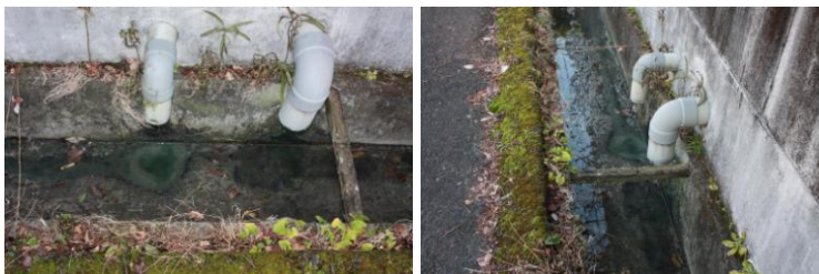
例 町内住宅地 家庭雑排水(台所排水)

また、これらの食品には栄養塩類である窒素やりんが含まれており、それらが町内の河川、海域に流れ込むと水質が悪化し、水環境の破壊や、水産物への被害に繋がっていきます。