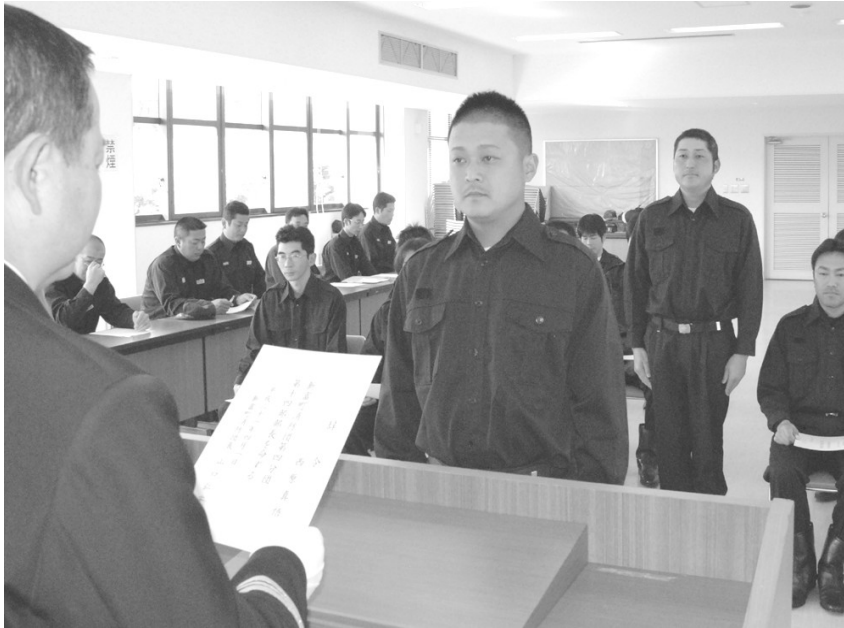
団長から辞令を受ける新部長