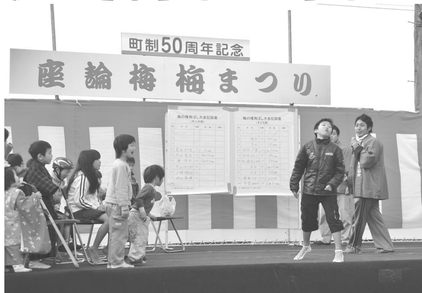
梅の種飛ばし大会で奮闘する子どもたち

見頃となった湯之宮座論梅にて町制50周年記念事業座論梅「梅まつり」を開催しました。