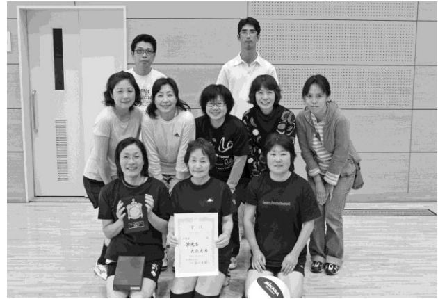
ミニバレー 2 部で準優勝した西五反田チーム

大会には、町の代表として西畦原・八幡・切通官舎・西五反田・新町・春日・下城元の 7 チームが参加し、各チームとも熱戦を繰り広げました。