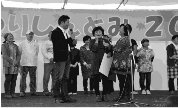
優勝インタビューの様子

11 月 23 日(水)まつりしんとみ 2011 で開催された新富町イチおしグルメ選手権 S-1 グランプリでは、ながのうどんの「とりごぼううどん」が初代チャンピオンに輝きました。