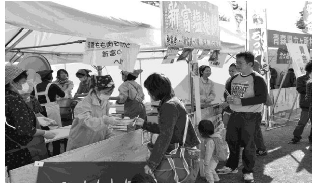
多くの来場者でにぎわう新富町の「塩麴鍋」ブース

11 月 20 日(日)、高鍋町のルピナスパークで開催された「東児湯鍋合戦」において、新富町代表の「塩麴鍋」が第 3 位に入りました。