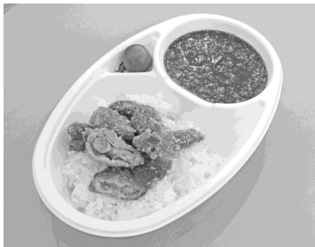
大好評だった「16種類の野菜と塩こうじせせりカレー」