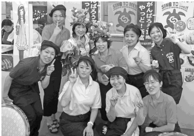
新富町チームとして出場した商工会女性部の皆さん