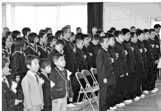
入学式にそろって臨む新小・中学生