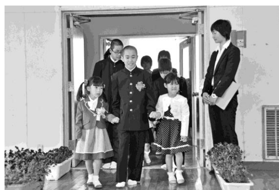
手をつないで一緒に入場する新小・中学生

新田小・中学校は、校舎や施設を一体化して整備し、今年4月から、小・中9学年で一つの学校ととらえる、施設一体型の小中一貫校「田園の里 新田学園」として新たにスタートしました。