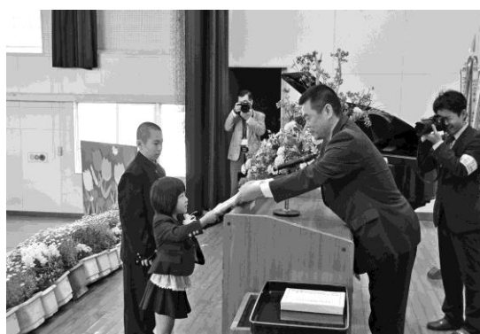
教科書贈呈も小・中学生一緒に