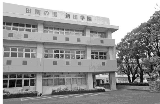
一体化して整備した小・中学校の校舎