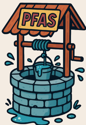
継続的な調査を求める

高鍋保健所と町が協力し、PFASが検出された基地内の井戸から概ね半径500メートル以内が存在する井戸の利用者に対し、安全のために井戸水の飲用を控え、町水道水などを飲み水として利用するよう勧められている。県は、当該範囲の井戸および河川などを対象に調査地点を選定し、調査を実施している。