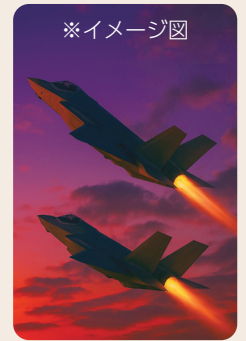
※イメージ図 急げ! 安全と騒音対策!!

町長 令和8年度の完成に向け、関係機関である西日本高速道路、県、本町において協議を行い、広報の手法や内容について検討を進める。