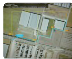
三納代地区農業用排水路整備事業