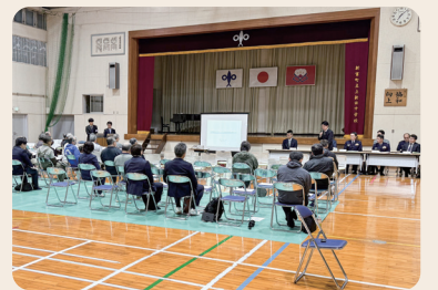
納得のいく説明を求める