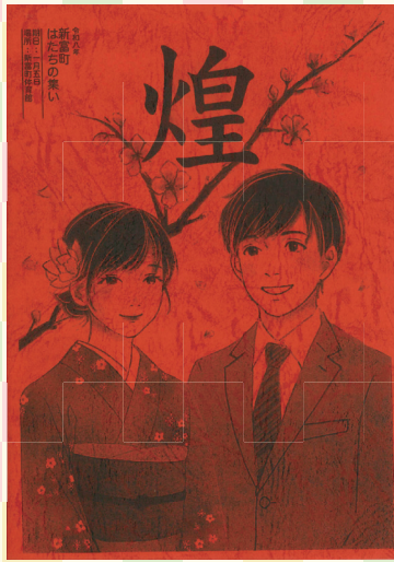
絵・題字：石田 真彩（上新田中）