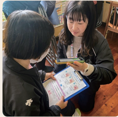
口腔体操を習慣に