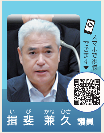
い び かね ひさ 捐 斐 兼 久 議員

問 残り約250世帯の工事は約4年かかる、次回のコンタール見直しまでに完了できるように、要望していただきたい。