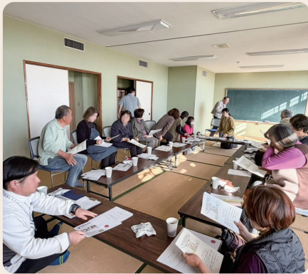
地域が一体となった見守り体制作り

町長 高齢者の見守りの手法としては、GPSをはじめ、QRコード入りのシールを身につけるなどIoTを活用したものの他、地域住民による見守りや、郵便局などの町内事業所と取り組んでいる新富町地域見守りネットワークなど「人の目」による見守りがある。地域の実情に合った支援を実施していく。