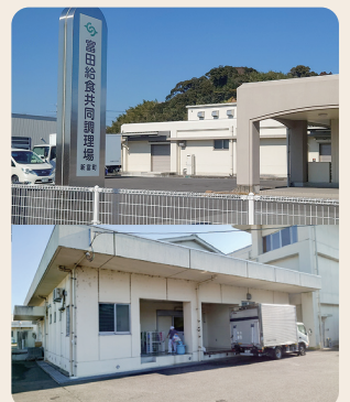
毎日約1,500食の給食を提供