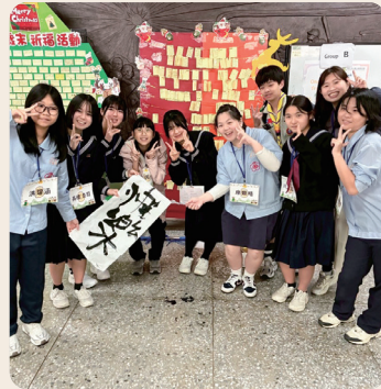
国際交流で多様な価値観を共有