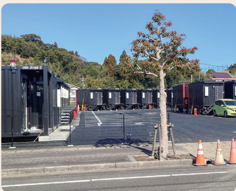
来町者の滞在時間延長に期待

町長 将来的には周辺地域に健康づくりを核とした多目的施設や店舗誘致を計画しているが、まずはコンテナホテルの開業に期待したい。