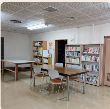
子どもたちの安心空間

教育長 ロビー部分には机や椅子を備え、学習等に利用できる状態で開放している。図書も常設580冊に加え、毎月70冊ずつ配布し新刊を入れ替えている。今後要望があればロビー以外の貸館状況を確認し、空いている部屋を開放することも可能である。