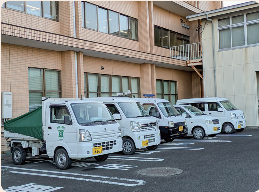
徹底した管理と有効活用を

町長 リース車2台を含め、総数は83台。うち13台は集中管理で効率的に運用し、70台は各課に配置している。日によって利用頻度は異なるが、集中管理の公用車が空いていない場合は各課管理の公用車を活用している。