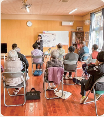
お口の健康は長生きの秘訣

町長 高齢者にとって口腔ケアは虫歯や歯周病、誤嚥性肺炎の予防に加え、食べる機能を維持することで低栄養の防止や栄養改善につながり、かみ合わせの安定による運動機能の維持にも重要。地区ごとに実施している介護予防教室や通いの場など、様々な機会で口腔ケアの重要性を伝え、家庭でできる口腔体操等の指導を行っている。