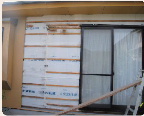
早期着工で待機期間の短縮を