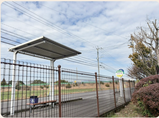
子どもや高齢者に優しいバス停を