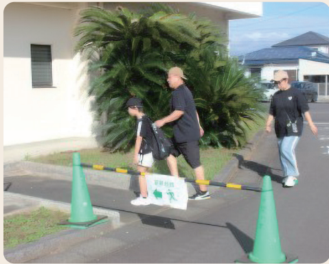
地域特性に応じた訓練計画を

町長 国や県の方針を踏まえ、本町の地域特性に応じた避難施設や救援体制を整備するため計画を作成している。政府の国民保護に関する基本指針の改定に伴い、町も計画の見直しを実施している。