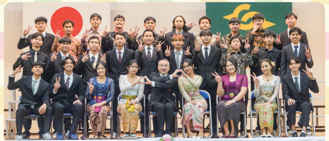
New adults with overseas roots