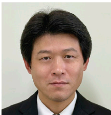
■英語教育アドバイザー