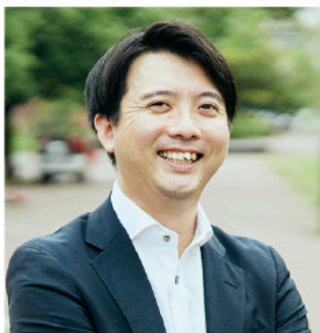
■新富町教育推進コーディネーター