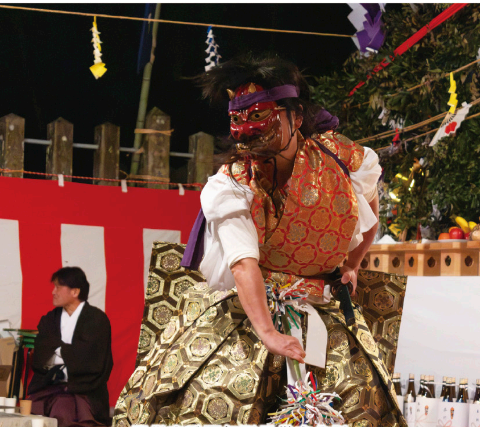
国指定重要無形民俗文化財 三納代神楽