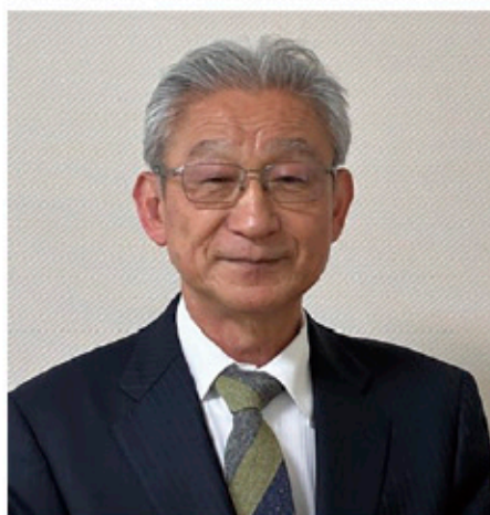
■新富町特別支援教育コーディネーター