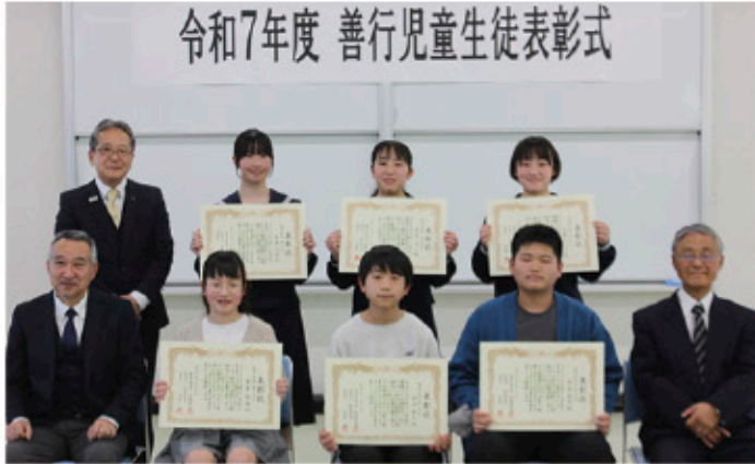
令和7年度 善行児童生徒表彰式

学力や運動能力だけでなく、思いやりや協調性、主体性といった「人間力」を高めることの大切さを改めて示す機会となりました。受賞された皆さんの今後のさらなる活躍が期待されます。