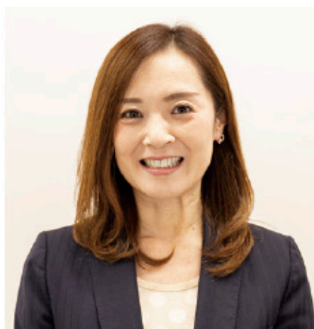
■探究学習アドバイザー