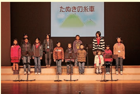
【しんとみ読みがたり事業】

複合施設建設に合わせ、子どもから大人まで本に親しむ機会を提供する各種事業に取り組み、読書による人づくりを推進。