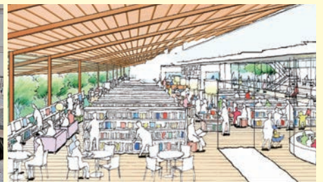
【複合施設建設事業】