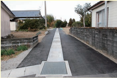
【仲伏地区排水路整備事業】