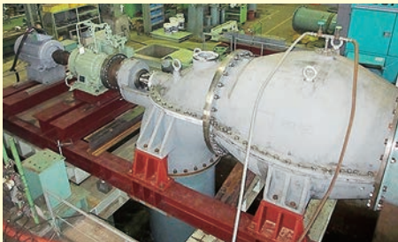
【横江排水機場改修事業】