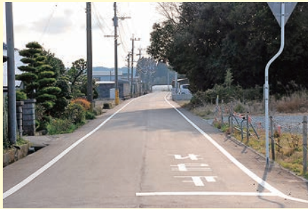
【八幡～大淵線舗装補修事業】