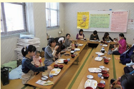
【赤ちゃんもぐもぐ教室】

本町では子育てしやすい町を目指して「こんにちは赤ちゃん訪問」「こどもの健診や教室」「子育て相談」「赤ちゃんもぐもぐ教室」などの各種事業へ取り組んでいます。