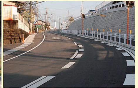
【佐土原～木城線道路改良事業】