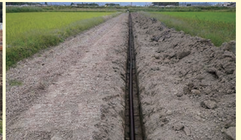
【暗渠排水整備事業】

水田の有効活用を図るため、国の補助事業を活用した、水田の暗渠排水を整備(71ha)