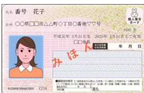
マイナンバーカード(写し)(表面)