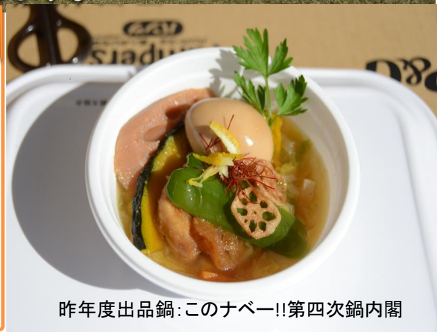
昨年度出品鍋:このナベー!!第四次鍋内閣