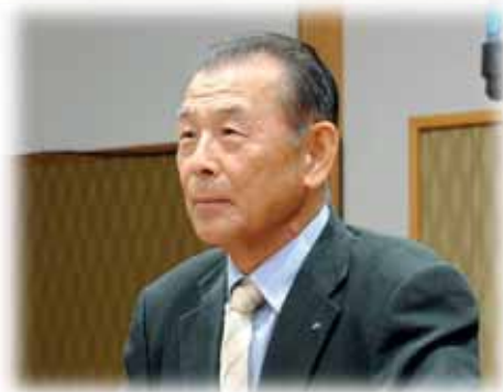
下村 豊 議員

問 新型コロナウイルス対策について、相談件数とPCR検査数はどうなっているのか。 答 相談件数は、2月5日から5月25日の間に、県全体で1万3千531件、うち高鍋保健所管内は691件。PCR検査数は、県全体で1358件、うち高鍋保健所管内は141件。本町の件数については公表していない。