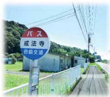
新田地区の発展に期待

答 公民館の移転に関しても新田中心部の利便性が高くなること、成法寺は大変魅力的な宅地であり、住環境をどう整えて利便性をどう高めていくか、しっかりと検討していきたい。併せて子育てしやすい環境を次世代に創って行けば、将来の担い手が新田に帰ってきて、家を建ててもらえる。そのような地域にしていきたい。