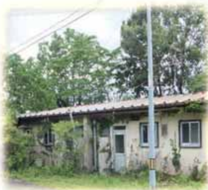
「新麓住宅」の今後は？

答 居住者の理解と協力を得ながら進めることが重要であり、本町の実情を踏まえ調査・検討を行い、ストック計画により適地を選定し進めていく。