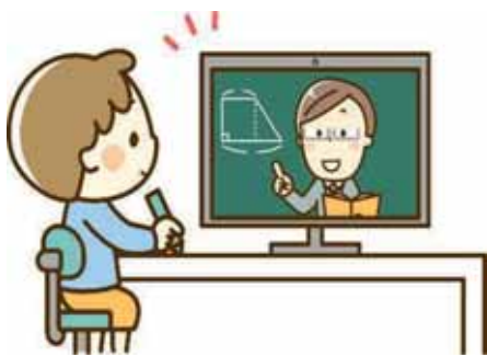
オンライン授業も 当たり前前の時代になる？

答 今回の臨時休業では、オンライン授業ができる環境ではなかったため実施しておりません。国が推進しているGIGAスクール構想による補助事業を活用し、今年度内に学校における校内通信ネットワーク環境整備と児童生徒一人一台の端末（タブレット）を整備することとしている。学校における授業の場と家庭学習の両面の活用が図られるよう年度内の整備を進めていく。