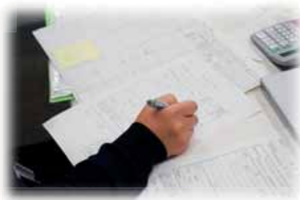
あんかけ焼きそばとエビチリですね