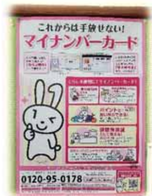
役場で申請できます