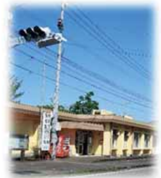
地元への説明が遅いのでは？

答 子育てにかかる経済的負担の軽減を図るため、中学生以下の均等割額について、2分の1の減免を行うもの。減免に伴う減収分、約360万円は、一般会計からの繰入を行う予定。