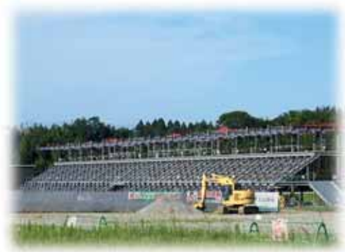
スタジアム完成はいつ？

問 まちづくり事業について 答 テグバジャード宮崎スタジアム建設を一時中断する事となり、今年度中のJ3昇格要件なども念頭に置いてオーナー企業と協議を重ねていく。 問 西都児湯医療センターについて 答 センターは西都市の中心にあり利用者は増加している。新病院の建設は西都市の方針によると現在の施設周辺に建設予定であると伺っている。本町の利便性について影響はない。引き続き医療提供体制を確保していただく。