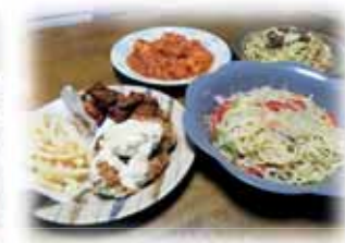
専用パックで来ました。お皿に移していただきまーす(^^)/