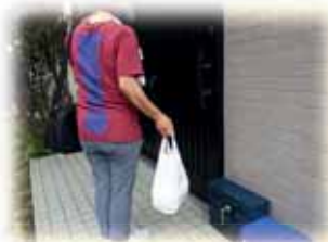
お待たせしました。ありがとうございます！