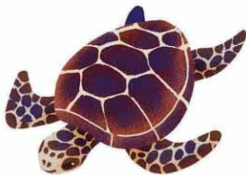
富田浜に産卵しにやってくるアカウミガメとか…