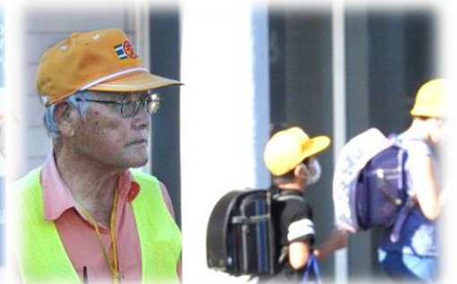
毎朝見守りありがとうございます!!