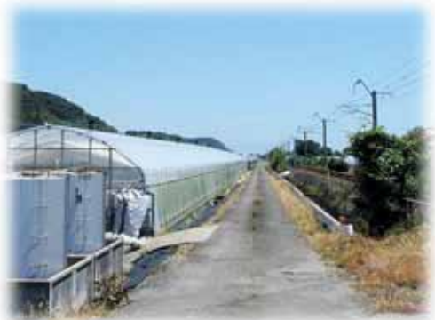
車両も大型化し通行が不便に

答 本町の農道整備については農地耕作条件改善事業による農道舗装や生コンクリート、及び砂利支給事業を活用し整備を実施している。平成30年度からは、農道の老朽化対策として、既存の舗装撤去を町が実施し、生コンクリート支給で活動組織による整備も行ってきている。農道拡張については、地元での用地確保、分筆処理を実施し、用地の寄付贈与をしていただくことで整備を実施している。 大持田地区についても拡張が必要な箇所は、用地確保など地元負担の調整が必要です。舗装改修箇所については生コンクリート支給事業を活用していただきたい。