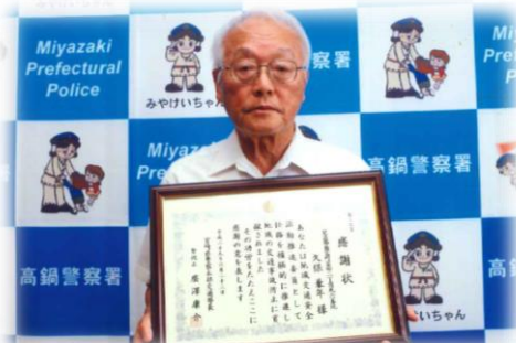
地域交通安全活動推進委員として感謝状を贈られる (平成 29 年)

「子どもたちの未来のために若い人の意見を取り入れて住みよい新富町にしてほしい」 (久保より)