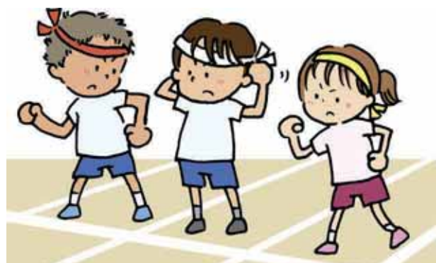
通常通り実施させてあげたいが...