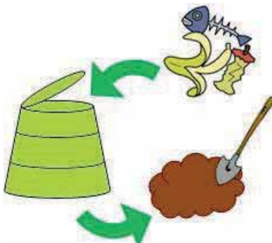
生ゴミは重くて運ぶのに一苦労