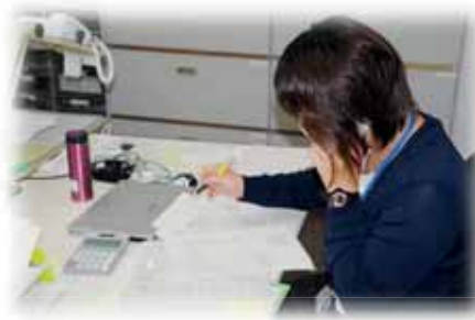
お電話ありがとうございます！