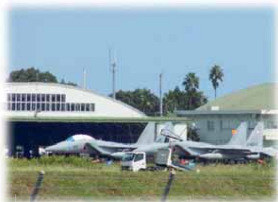
まもなく始まる施設整備の工事

答 現在、国は工事に係る準備を進めており、国の責任において、安全対策、騒音対策等を行い、負担を受ける自治体に対する丁寧な対応と周辺住民に対する十分な説明を行うことを申し入れている。なお、経済産業大臣の承認はまだ出ていないと聞いている。