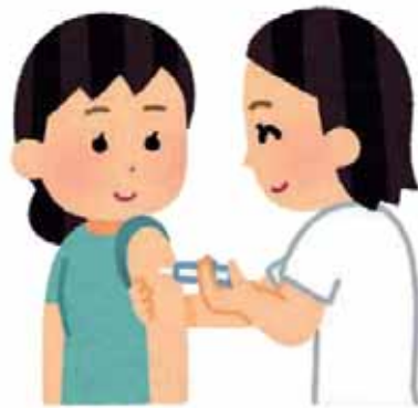
子育て世代の負担軽減を

答 新型コロナウイルスの影響を鑑み、インフルエンザの予防は重要な案件の一つであります。