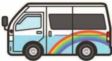
遠くからでも分かりやすいカラーリングを