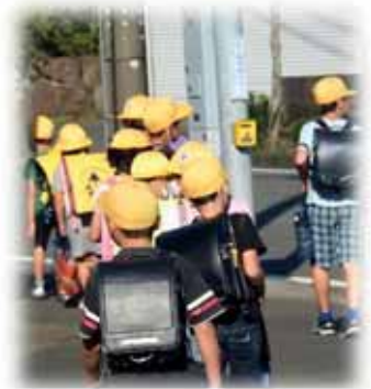
学校が再開し元気に登校する子どもたち

問 今後、学校閉鎖や児童生徒が感染者になった場合は長期の欠席が考えられる。欠席することによる個人的な学習の遅れも心配される。ケア、サポートの対策は。