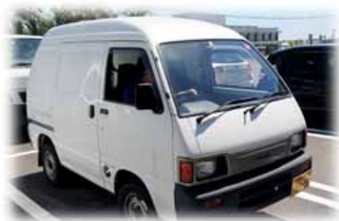
配達いってきまーす(‘◇’)ゞ