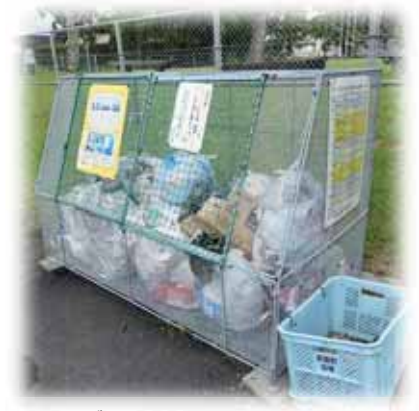
生ゴミは重く徒歩だと大変

答 電話機を外すことは、連絡手段がなくなる等不都合が生じるので避けて頂きたい。振り込み詐欺にあわないよう周知啓発に努める。