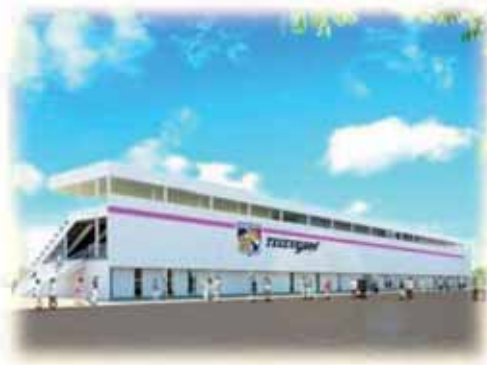
ホームの試合が楽しみです

答 宮崎県内1チームの県民球団となることを目標にして、積極的にPRするなどの対応をしていきたい。