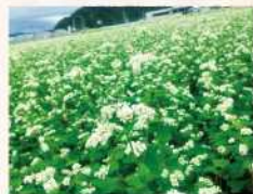
そばの花 -Soba Flowers-

You can enjoy the ever-changing flowers and trees by the season. In winter, Cymbidium flowers which are a local specialty decorate the town. In Autumn, Soba flowers and the autumn leaves of the large ginkgo tree said to be over 600 years old colors the town a different color again.