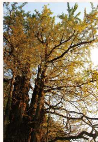
春日の大銀杏 -Large Ginkgo Tree of Kasuga-