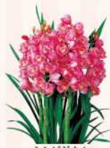
シンビジウム -Cymbidium Flowers-