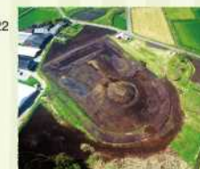
百足塚古墳 -Mukadezuka Burial Mound-

2018年 日本遺産にも登録。Registered as a Japanese Heritage site in 2018.