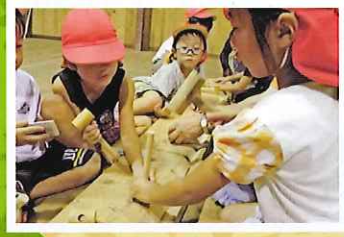
森林に親しむ幼児期の意識づくり