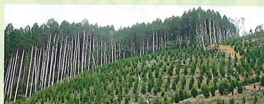
【伐採跡地の再造林】

広葉樹の植栽や伐採後の速やかな再造林、溪流などに流出した流木などの撤去、再造林実施箇所を対象とした木質バイオマス資源の収集運搬や、花粉の少ない優良苗木の生産拡大などを支援します。