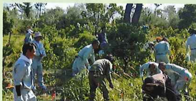
【県民ボランティアの集い】

森林ボランティア団体や企業など多様な主体による森林づくり活動の支援や、普及啓発活動などに積極的に取り組みます。