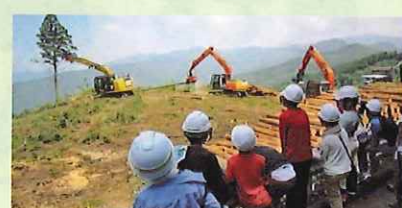
【森林のいいところ発見バスツアー】