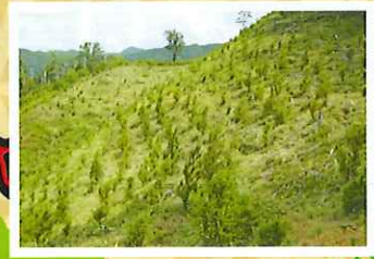
水を貯え、災害に強い森林づくり

県では、宮崎県森林環境税を活用して森林を健全な姿で次世代に引き継ぐため、森林を県民みんなで守り育てる意識の醸成や、健全で多様な森林づくり・森林環境教育などに取り組んでいます。