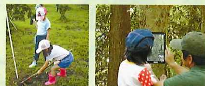
【宮崎県ひなもり台県民ふれあいの森】