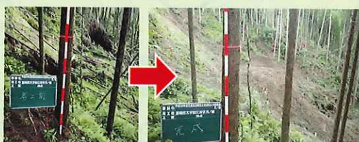
【台風などにより堆積した流木などの撤去】