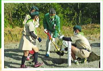
多様な主体による森林づくりの推進