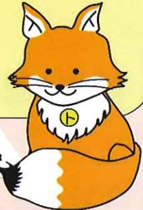
不動産登記推進イメージキャラクター「トウキツネ」

二次、三次の相続が発生すると、相続人が増加し、権利関係が複雑になる。 相続人の調査に時間がかかり、費用が高額になる。 遺産分割に協力しない又はできない相続人が出てくる。 不動産処分（売買など）が難しくなる。 公的買収や災害復興の妨げになる。