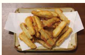
ごぼうのビール揚げ

醤油ベースで煮込んだ豚肉は、生姜の香りが鼻に抜け食欲をそそります。肉は口に入れると、ほろっとくずれ、なんこつは程よく弾力があり、おかずやお酒のつまみにピッタリ！最高の一品です。