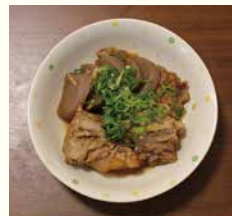
豚のなんこつと こんにゃくのしょうが煮

うどん、から揚げ、いなりずしがセットになってボリューム満点！お屋の人気メニューとなっています。