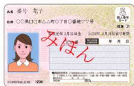
マイナンバーカード表面（見本）

しかしながら、現在、19歳から74歳までの町民のみなさんのマイナンバーカードによる公金受取口座登録者は6割に留まっております。この機会に、今後、同様給付が円滑にできるよう、 2月20日 までに公金受取口座の登録をお願いします。なお、 3月上旬 までに、公金受取口座情報のある方には「口座情報確認依頼書」を、情報がない方には「申請書兼請求書」を送付いたします。