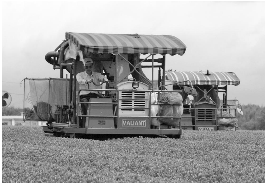
新茶を専用の機械で収穫する町内農家