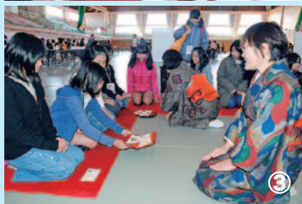
写真：①餅つき ②お菓子の家づくり ③茶道 ④クリスマス飾りづくり ⑤数珠玉ネックレスづくり