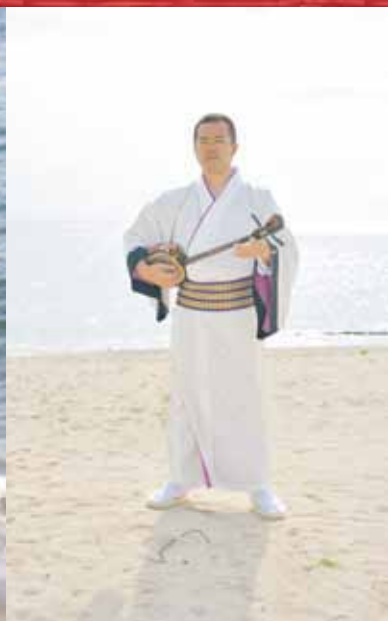
沖縄民謡 舞風 (め〜かじ〜)