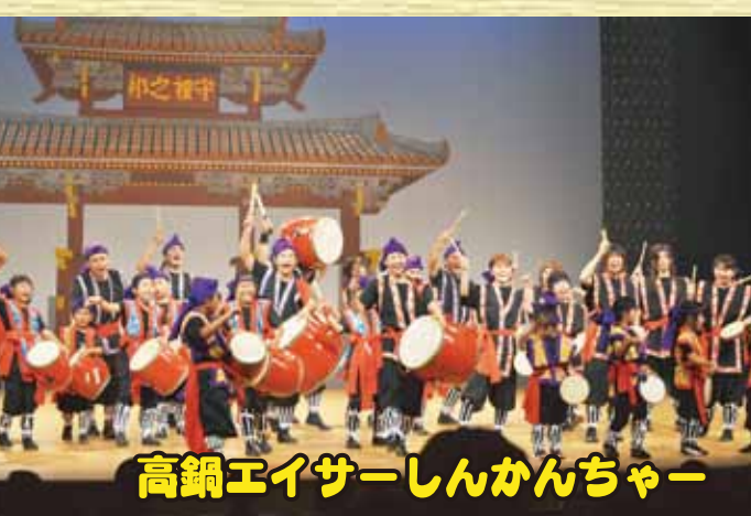
高鍋エイサーしんかんちゃー