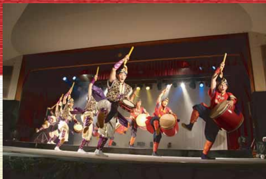
創作芸団 レキオス