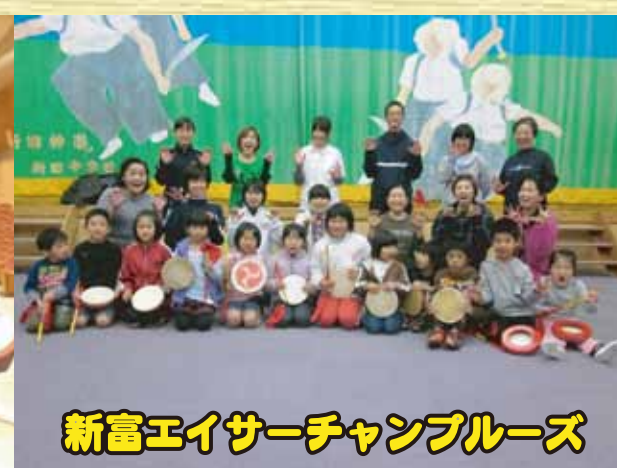
新富エイサーチャンブルーズ

五心会・潮わらば一會・慈愛保育園・産経大学うるま会・南九州大学沖縄県人会・野尻エイサー隊東風・高崎エイサー風車・綾エイサーチーム 九州保健福祉大学エイサーサークル琉球魂・中九州短期大学エイサー・橋太鼓 響座・新富和太鼓みらい・セミコンキッドピクス (出演者は変更になる場合があります)