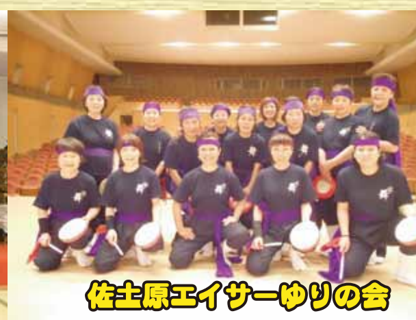
佐土原エイサーゆりの会