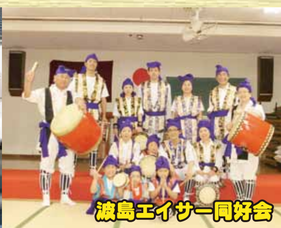
波島エイサー同好会